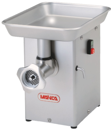
PM-70 / PM-12