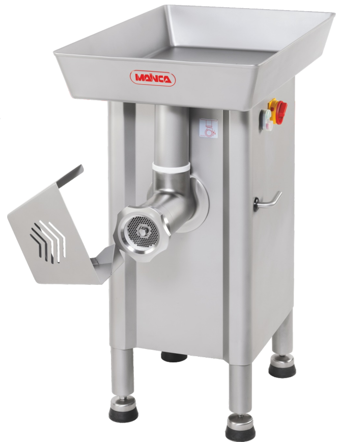
PC-98L / PC-32L PC-114L