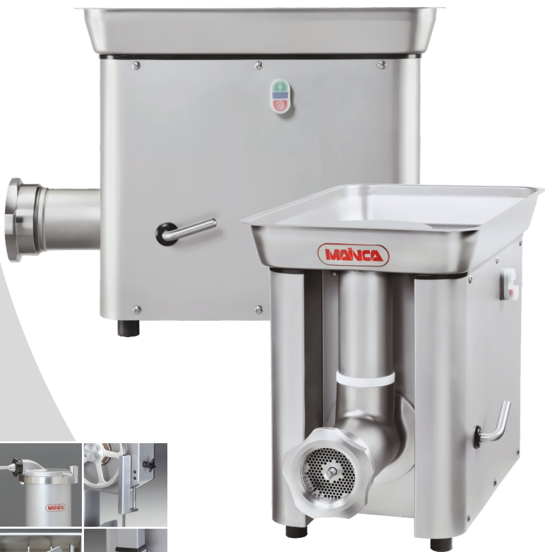
PC-98 / PC-32 PC-114