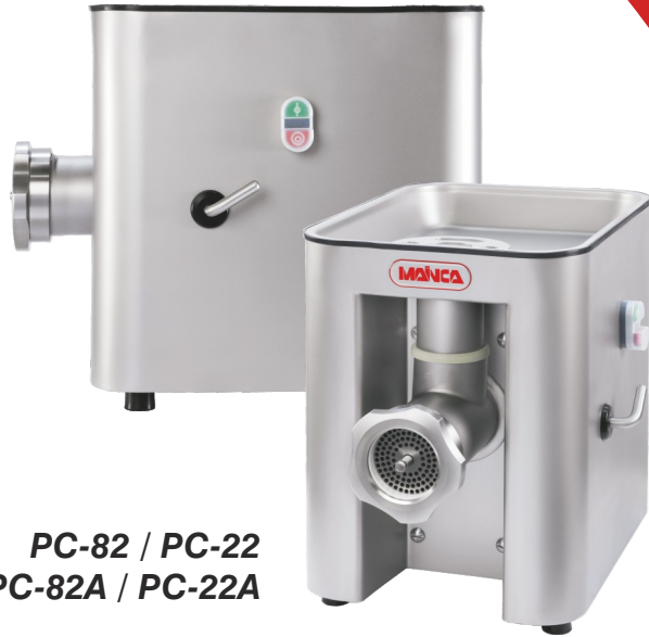
PC-82 / PC-22 PC-82A / PC-22A