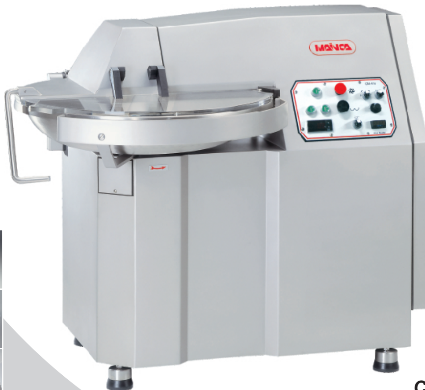
CM-41 / CM-41S